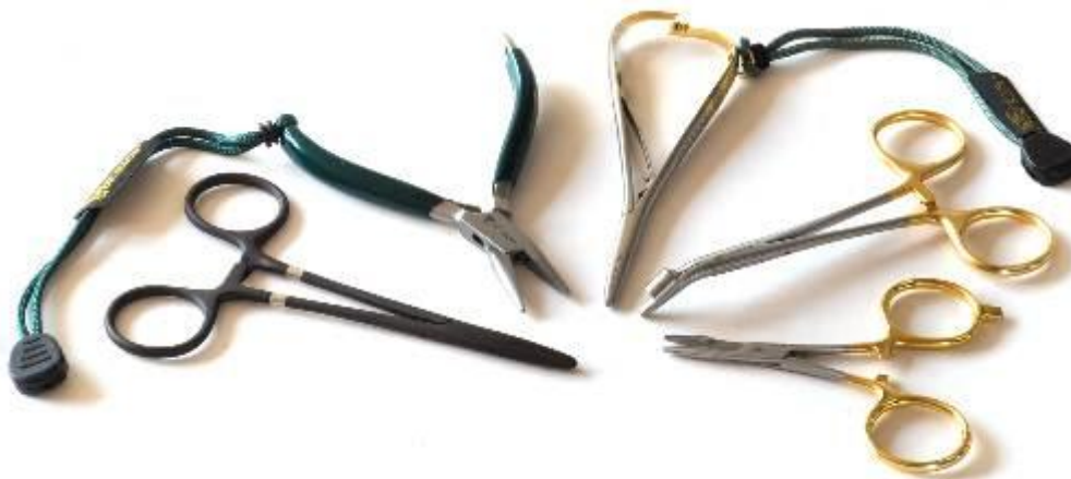
Foto 3. Krogløsertænger. Kvalitets-krogløsere (også kaldet peaner) sikrer en skånsom afkrogning af især yderligt krogede fisk. Fra venstre mod højre ses først tre krogløser fra firmaet Dr. Slick: Standard, Barb Plier (særligt fremstillet til at klemme modhager ned) og Mitten. Til højre ses to krogløser fra Sierra: Hookrelease forsynet med en krogfjerner (disgorger), og en kombineret saks og krogløser.