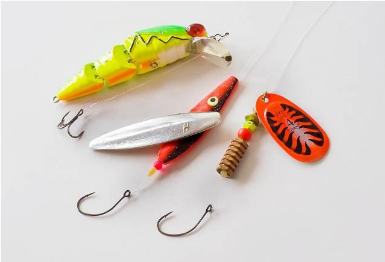
Foto 2: Gennemløbsmonteringer som disse, hvor kunstagnen kan glide frit op ad linen ved hug, har et stort potentiale i relation til at nedbringe dødeligheden ved genudsætning. De gør det nemlig muligt at afkroge fisken, mens den stadig er under vand. Med normale kunstagn, hvor krogen sidder direkte i kunstagnen, er den skånsomme afkrogning under vand som regel ikke mulig. Øverst: Release-takel. Midt: Gennemløbsblink. Nederst: Gennemløbsspinner Spinner (hjemmelavet).