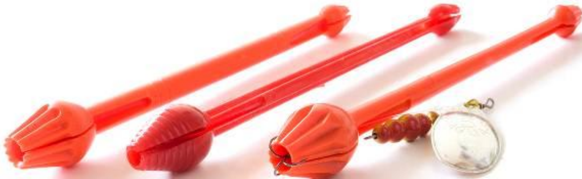
Foto 4. Krogfjernere. Et udvalg af krogfjernere (også kaldet disgorgers) på det danske marked. Bemærk, at krogspidserne maskeres af fortykningen på disgorger-hovedet, så man ikke risikerer, at krognen får fat på ny, når den trækkes ud af munden på fisken. De viste krogløser fungerer perfekt på dybt krogede fisk op til 4-5 kilo, men til større fisk er de for korte. Til større laks, som er dybt kroget, bruges en krogfjerner, som er 25-30 centimeter lang.