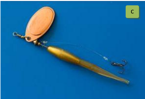
Foto 1. Efterhængt krog - også kaldet hook-extension, praktiseres ved at montere wobler og spinner som på billederne, hvorved det er nemt at klippe kroget af, hvis fisken er dybt kroget. Krogen bindes i en stump 0,45-0,50 mm nylon. Krog og linetafs monteres lettest og bedst med en rapala-knude, hvor øjet ikke er større end krogøjet. a) Efterhængt krog, b) Helikopter-rig og c) Helikopter-rig på kondomspinner.