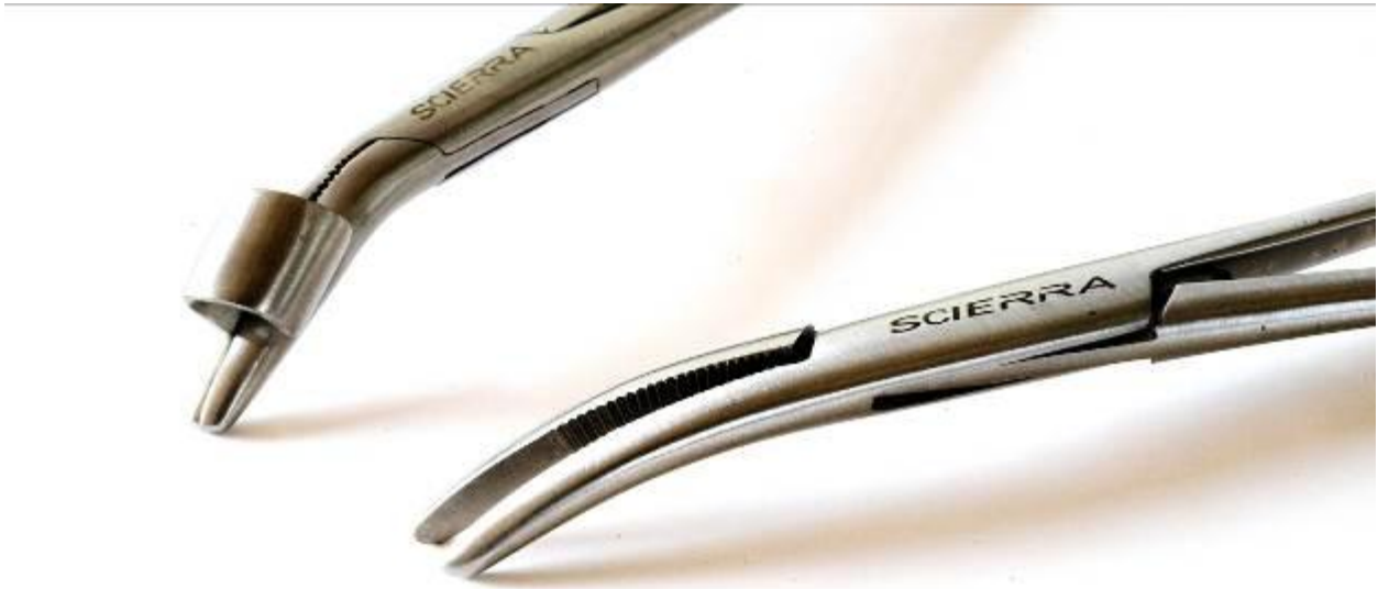
Foto 5. Krogløsertang med bøjet næb. En krogløser som denne gør det lettere af få krogen ud, når den sidder lidt dybere end yderst i kæben. Modellen øverst kan anvendes til at guide krogløseren ned på rette sted og skubbe krogen baglæns ud, hvis det er svært at få fat med krogløsertangens kæber. Til ekstremt dybtkrogede fisk, er den dog ikke nær så god som de viste plastic-krogløsertænger, fordi den ikke afskærmer krogspidserne, når krogen føres ud af munden på fisken.